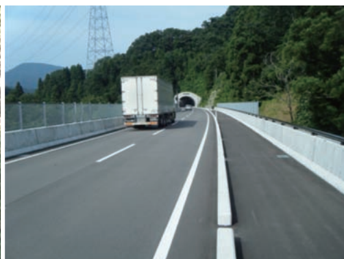
（整備後） 安全で快適な通行が確保された