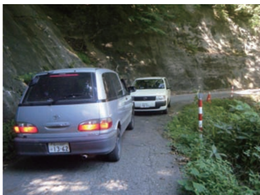
（整備前） 狭小な幅員によりすれ違いが困難

事業名 いしかわ広域交流幹線軸道路整備事業 主要地方道金沢井波線荒山工区 受賞機関 石川県県央土木総合事務所 実施期間 平成16年4月～平成23年4月