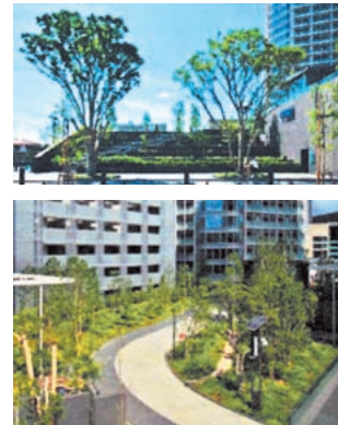
Ⅲ街区大規模緑化（誰もが入れる回遊空間）