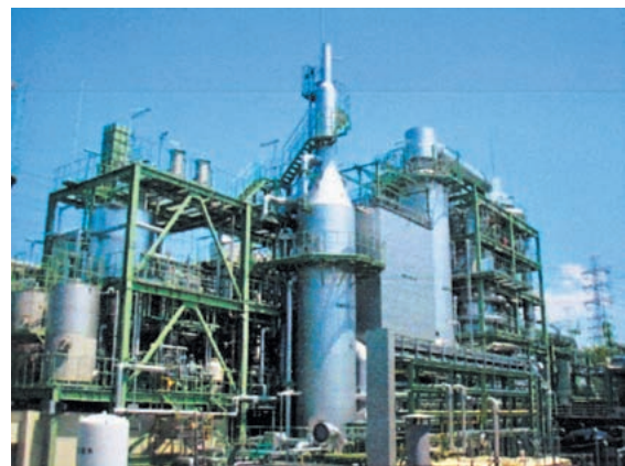
汚泥ガス化炉 全景