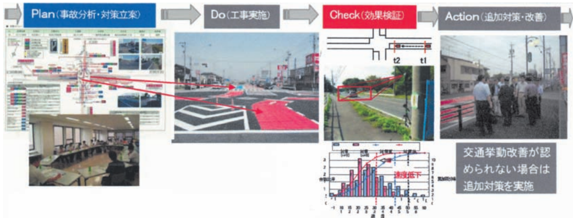
PDCAマネジメントの流れ

事業名 交通事故死者数全国ワーストの返上を目指して～交差点のカラー舗装化～ 受賞機関 愛知県建設部道路維持課 実施期間 平成20年度～平成21年度