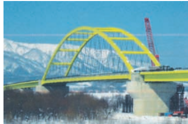
ニールセンローゼ橋