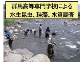
群馬高等専門学校による水生昆虫、珪藻、水質調査