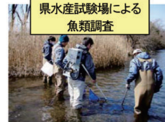
県水産試験場による魚類調査