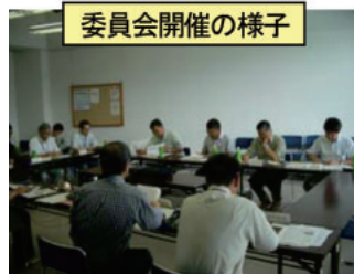
委員会開催の様子