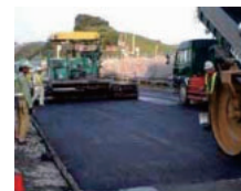
アスファルト舗装工