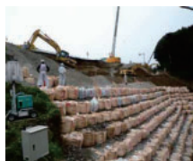
セメント安定処理工