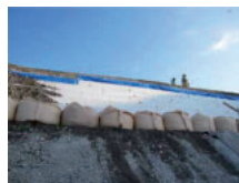
大型発砲スチロール