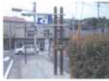
誘導サイン(支柱タイプ) 杉間伐材を使用