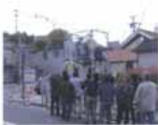
地域のみなさんと サインの設置