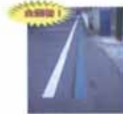
誘導ライン(セーフティライン) 全国初! 路面に 緑色のライン