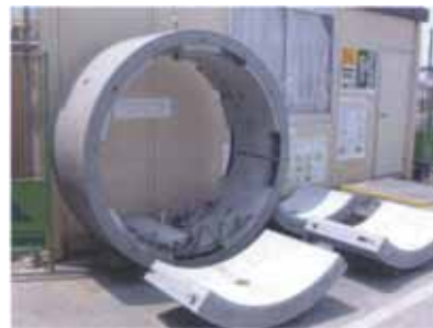
コンクリート中詰め鋼製セグメント