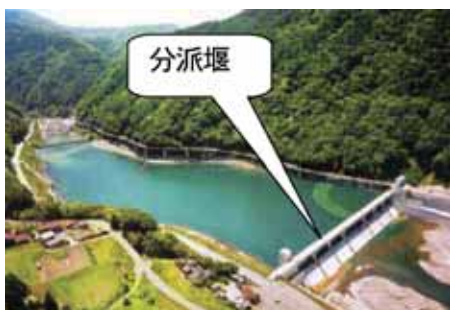
湛水後の分派堰を上空から望む