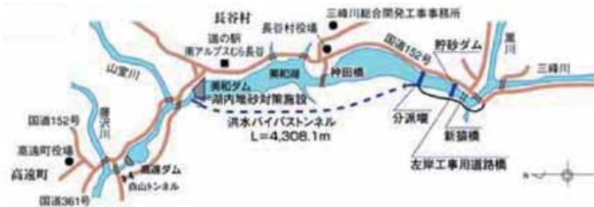
位置関係図（分派堰～洪水バイパストンネル～吐口）