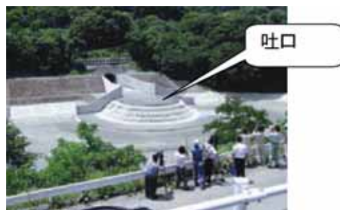
試験運用後における吐口からの放流状況