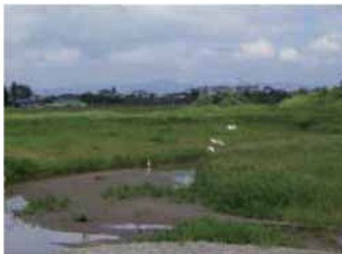
蛇行水路（白サギ飛来）