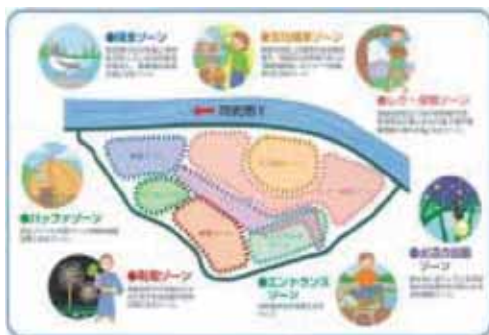
遊水池内利活用ゾーニング計画