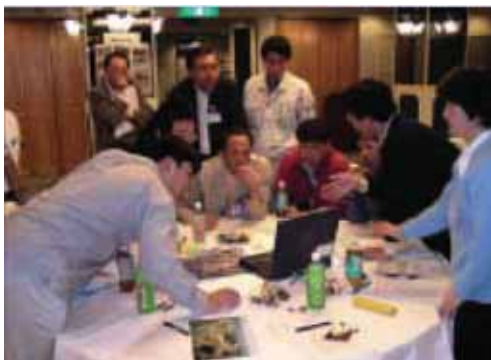
ワークショップ検討の様子