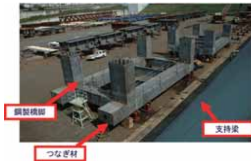
鋼製直接基礎部材