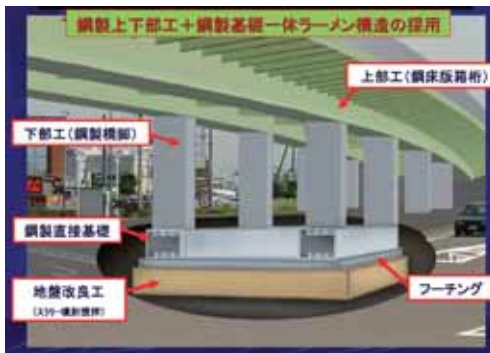
橋梁本体のプレハブ化