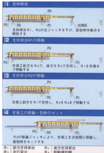
大型移動支保工の移動手順

外ケーブルを多く使用することで、断面の縮小化及び経済性や耐久性の向上を図っています。 外ケーブル併用工法