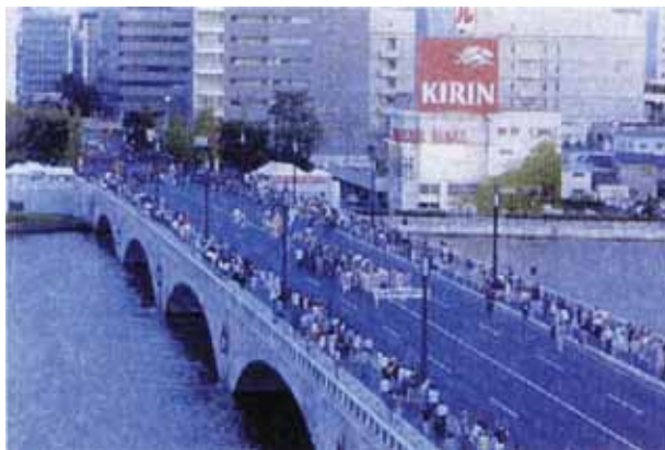
重要文化財指定記念パレードの様子