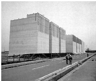
斜底面ケーソン製作状況

このような背景のもと、近畿地方整備局では、(独)港湾空港技術研究所及び民間で組織する研究グループと共同して、経済性に優れ耐震性の高い「斜底面ケーソン工法」の開発を進め、和歌山県日高港 御坊地区 岸壁(12m)の耐震強化岸壁取付部の整備に採用した。「斜底面ケーソン工法」は、基礎マウンド上面及びケーソン堤体底面に勾配をつけ、陸側に向かって深くすることにより、背後土圧や地震力に対する滑動抵抗力を増大させ、従来のケーソンより堤体幅を狭くすることが可能であり、その特徴は次のとおりである。