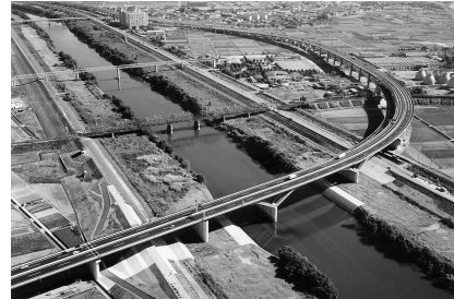
宇治川上空より久御山JCT方面を撮影

を採用するなどコスト縮減に取り組むとともに併設する一般国道478号は同時に施工、重交通路線の名神高速道路や国道171号並びに東海道新幹線が近接又は交差する個所の施工にあたっては夜間工事を主体に実施することにより他交通への影響を避けるなど、施工の効率化・円滑化にも努めた。