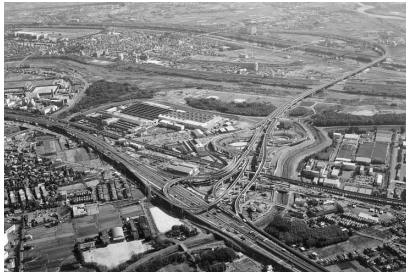
大山崎JCT上空より久御山JCT方面を撮影

このうち、一般有料道路京滋バイパスの巨椋ICから名神高速道路の大山崎JCT間(延長約8km)の自動車専用道路とそれに併設する一般国道478号(延長約5.7km)を国土交通省と日本道路公団による同時施行として事業を行った。