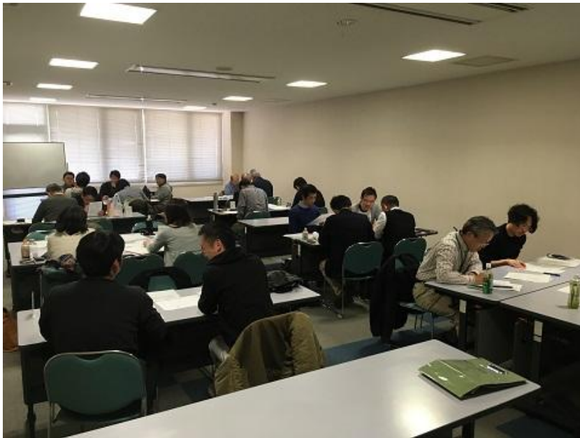
●●総監部門講義の様子●●