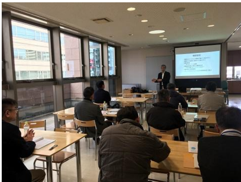
●●総監部門個別指導の様子●●