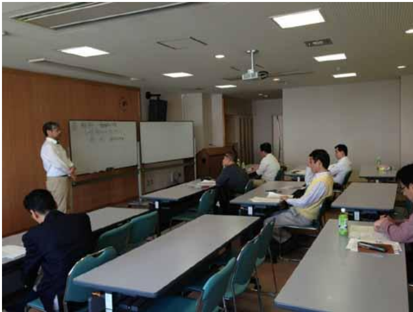
経歴書のグループ討議の様子 講師の技術士により、“技術士にふさわしい点はどこか”を徹底的に討議し、より良い経歴書に仕上げていきました。