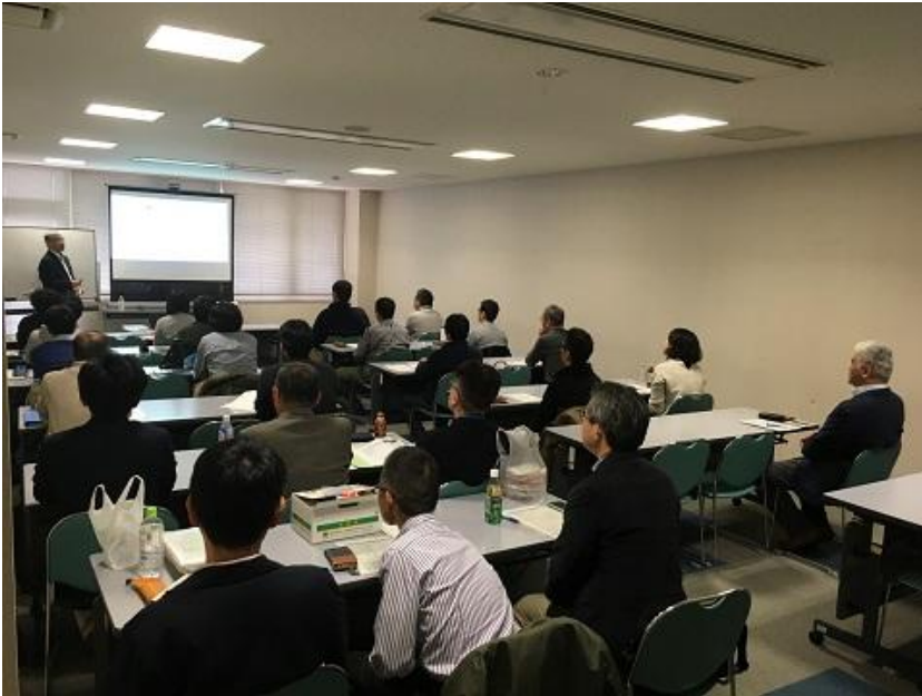
●●一般部門個別指導の様子●●